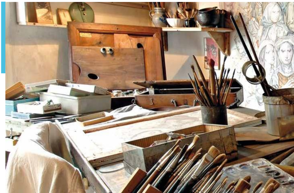
Coll. CD91 Maison-atelier Foujita. Photographie Laurence Godart. ©Fondation Foujita / ADAGP 2022.

Afin de proposer une expérience complète, le département a acquis la propriété jouxtant la Maison-atelier pour en faire un espace d'exposition complémentaire à la visite. La scénographie habillant les deux pièces a été totalement repensées lors du bicentenaire du peintre, proposant une exposition permanente retraçant sa vie, à Paris et à Villiers-le-Bâcle.