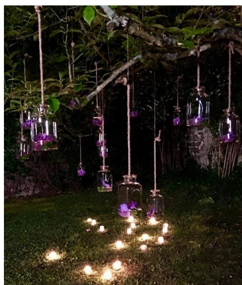
Nuit des Musées à la Maison-atelier Foujita

Ces temps forts rythment la saison estivale de l'établissement. L'inscription des événements dans les agendas nationaux permettent d'assurer une importante visibilité de la Maison-atelier Foujita. Les activités proposées pendant ces manifestations, en partenariat avec des artistes, drainent un nombre de visiteurs important.