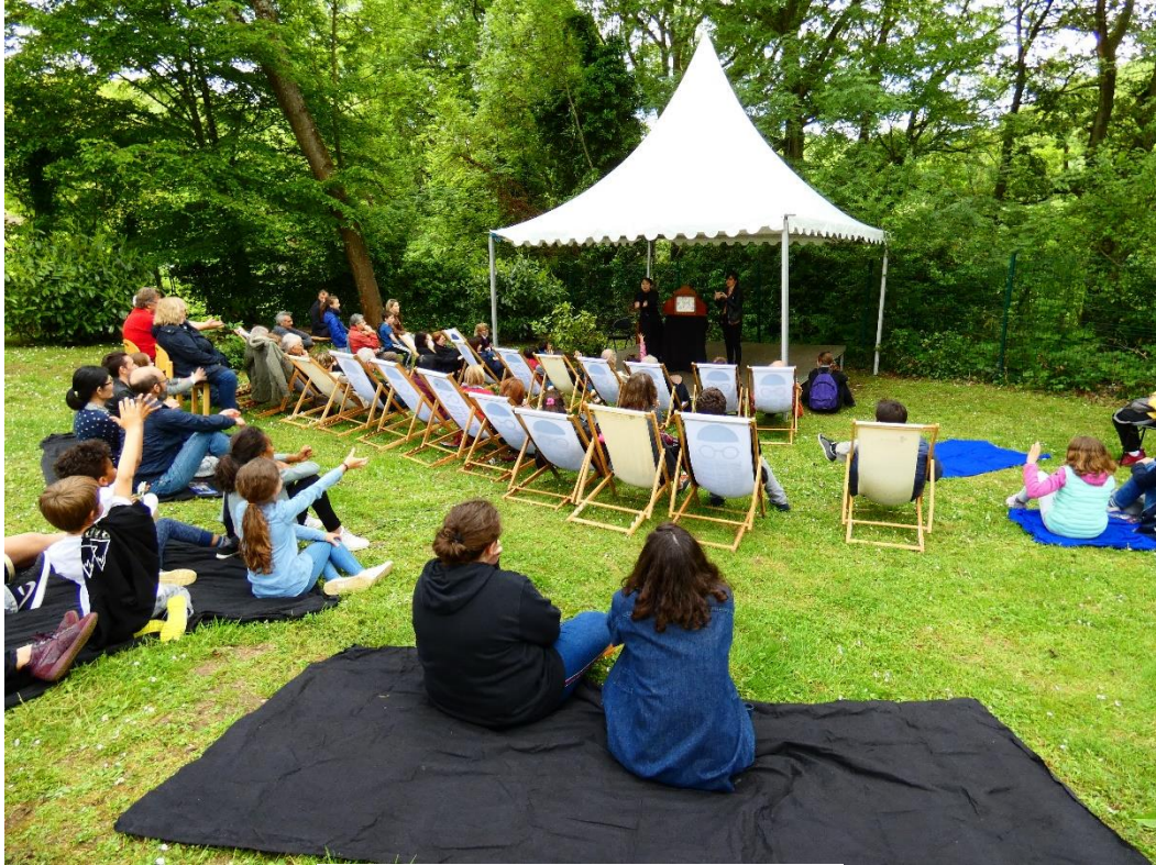
Concert à la Maison-atelier Foujita

La Maison-atelier Foujita accompagne ses ateliers d'animations extérieures/spectacles vivants : concerts de musique traditionnelle japonaise ou de jazz, représentations théâtrales... dont la programmation est ciblée en fonction de la thématique nationale.