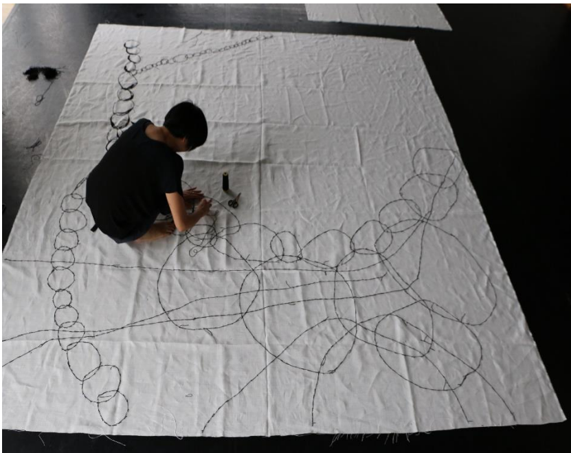
Réalisation de Departure par Rieko Koga, 2014, broderie à la main.

Rieko Koga exprime son univers avec des fils et des aiguilles. Après avoir fait des études de mode à Tokyo puis à Paris, elle se tourne finalement vers les arts et s'installe à Paris en 2004. Brodant au fil de son inspiration, Rieko improvise, créant des œuvres directement sur la toile, en se laissant librement guider par le mouvement de ses mains.