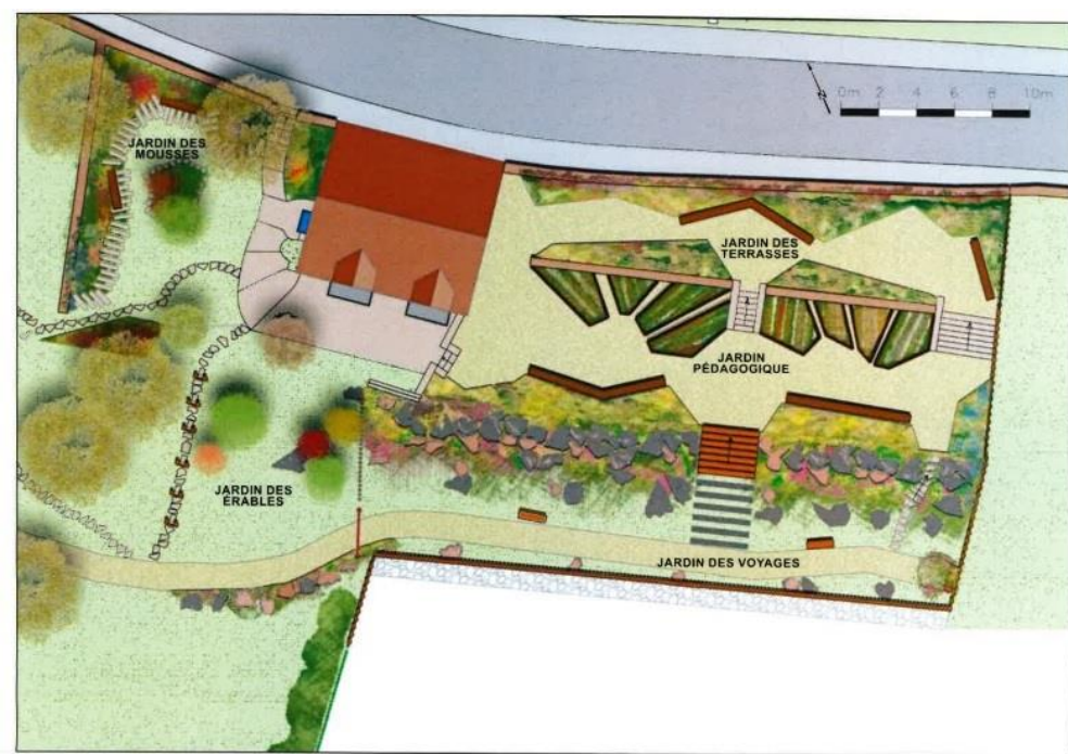
ETUDE D'AMÉNAGEMENT PAYSAGER AUTOUR DES JARDINS DE LA MAISON ATELIER FOUJITA

Projet d'aménagement paysager du jardin