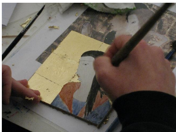
Atelier d'art plastique avec Valérie Martin