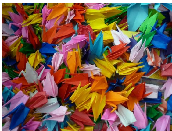
Atelier Origami