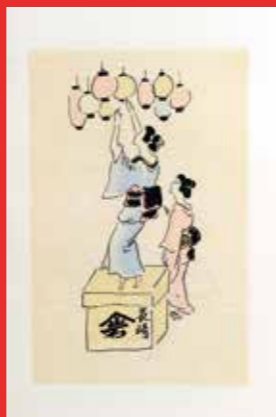
Madame Chrysanthème, Pierre Loti, 1926. Coll. CD91 © Fondation Foujita, ADAGP, Paris 2022.

De 11h à 19h, ateliers ouverts à tous les publics, en continu, sur le thème du goût et des couleurs. Inscription sur place. Pas de réservation par mail ni par téléphone.